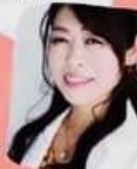
トークセッション 進行役/ 歯科治療食トーク