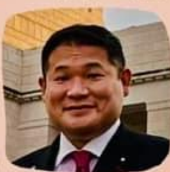
II 衆議院議員 山本剛正氏