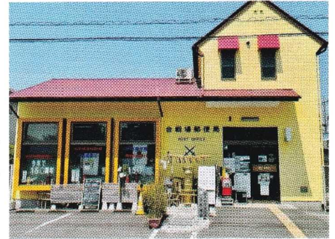
【合戦場(かっせんば)郵便局】